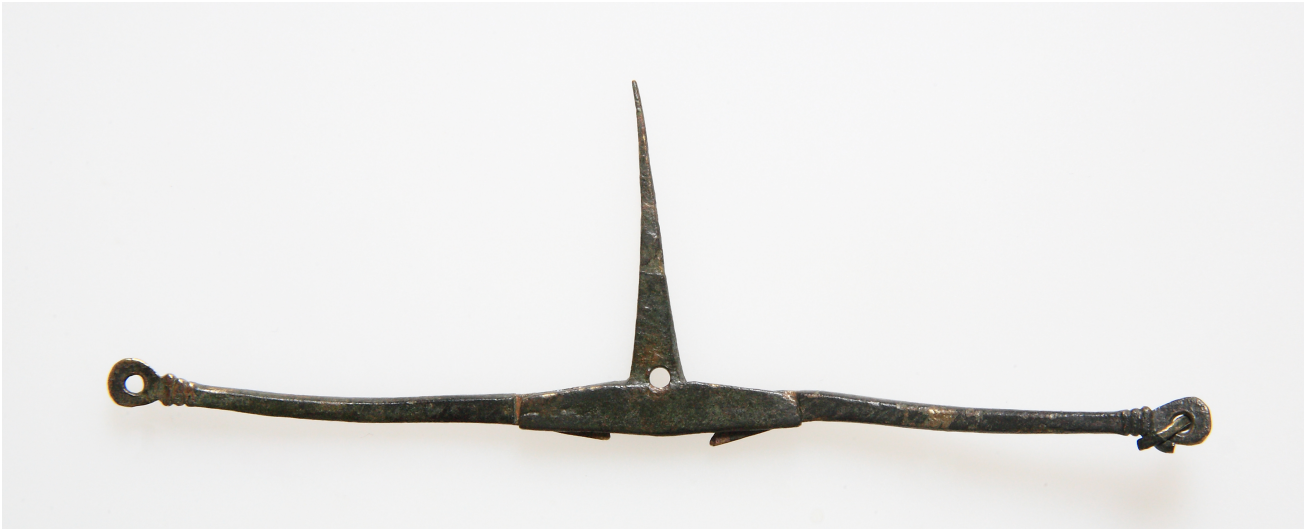
2. kép. A mérleg nyitott állapota

vagy fém eszközként kerültek bejegyzésre ezek a tárgyak. A kézi mérleg kifejezetten olyan tárgytypus, mely valószínűleg drága eszköznek számított, nagyon vigyáztak rá, szükség esetén megjavították (ROSTA 2017, 148).