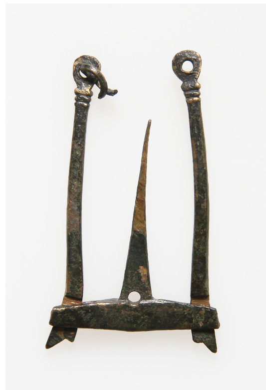
3. kép. A mérleg zárt állapota

A csontkúti lelőhely kutatását a jövőben múzeumbarát önkénteseink közreműködésével tervezzük folytatni, továbbá terepbejárásokkal és geofizikai (talajradaros) felmérésekkel is szeretnénk bővíteni tudásunkat a lelőhelyről.